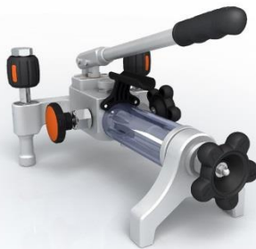
ADT 928 Pompe à main hydraulique : -0.85 bar à 1000 bar

Pression: -0.85 bar à 700 bar. Media: huile ou eau déminéralisée (livrée avec Huile) Matériaux Adaptateurs: SST Corps de pompe: SST/aluminium Joint: Buna-N Connexion: 1/4" NPT femelle ou, 1/4" BSP femelle ou M20X1.5 femelle Dimensions Hauteur: 135 mm Base: 290 mm x 198 mm Masse: 3.2 kg