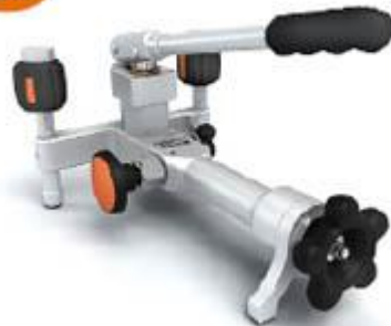
ADT 917 Pompe de test pneumatique -0.95 bar à 70 bar

Pression : -0.95 bar à 70 bar Résolution de réglage : 0,1mbar Media : air Matériaux Adaptateurs: SST Corps de pompe: SST/aluminium Joint: Buna-N Connexion: 1/4" NPT femelle ou, 1/4" BSP femelle ou M20X1.5 femelle Dimensions Hauteur: 140 mm Base: 315 mm x 198 mm Masse: 2.6 kg