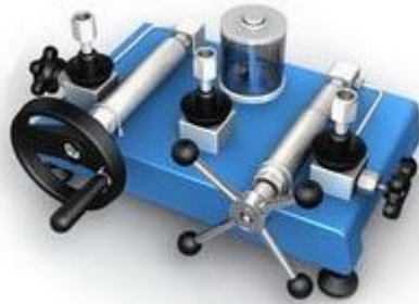
ADT 949 Pompe hydraulique 2500 bar