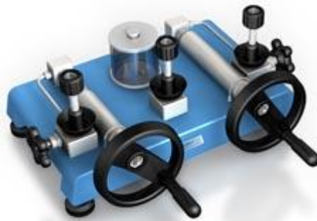
ADT 936 Pompe hydraulique 1000 bar

Pression: -0.85 bar à 1000 bar. Media: huile ou eau déminéralisée(option) (livrée avec Huile) Matériaux Adaptateurs: SST Corps de pompe: SST/aluminium Joint: Buna-N Connexion: 1/4" NPT femelle ou, 1/4" BSP femelle ou M20X1.5 femelle Dimensions Hauteur: 162 mm Base: 345 mm x 215 mm Masse: 3.9 kg