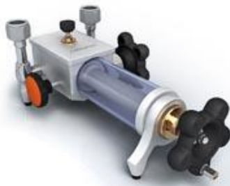
ADT 925 Pompe à main hydraulique -0.85 bar à 400 bar.

Pression : -0.95 bar à 200 bar Résolution de réglage : 0,1mbar Media : air Matériaux Adaptateurs: SST Corps de pompe: SST/aluminium Joint: Buna-N Connexion : 1/4" NPT femelle ou, 1/4" BSP femelle ou M20X1.5 femelle Dimensions Hauteur: 178 mm); Base: 540 mm x 270 mm Masse : 6.5 kg