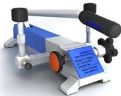
ADT 919A Pompe de test pneumatique -0.95 bar à 140 bar

Pression : -0.95 bar à 100 bar Résolution de réglage : 0,1mbar Media : air Matériaux Adaptateurs: SST Corps de pompe: SST/aluminium Joint: Buna-N Connexion: 1/4" NPT femelle ou, 1/4" BSP femelle ou M20X1.5 femelle Dimensions Hauteur: 140 mm Base: 315 mm x 198 mm Masse: 2.6 kg