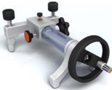
ADT 927 Pompe à main hydraulique : -0.85 bar à 700 bar

Pression: -0.85 bar à 700 bar. Media: huile ou eau déminéralisée (livrée avec Huile) Matériaux Adaptateurs: SST Corps de pompe: SST/aluminium Joint: Buna-N Connexion: 1/4" NPT femelle ou, 1/4" BSP femelle ou M20X1.5 femelle Dimensions Hauteur: 135 mm Base: 290 mm x 198 mm Masse: 3.2 kg