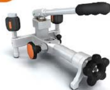
ADT 918 Pompe de test pneumatique -0.95 bar à 100 bar

Pression : -0.95 bar à 100 bar Résolution de réglage : 0,1mbar Media : air Matériaux Adaptateurs: SST Corps de pompe: SST/aluminium Joint: Buna-N Connexion: 1/4" NPT femelle ou, 1/4" BSP femelle ou M20X1.5 femelle Dimensions Hauteur: 140 mm Base: 315 mm x 198 mm Masse: 2.6 kg