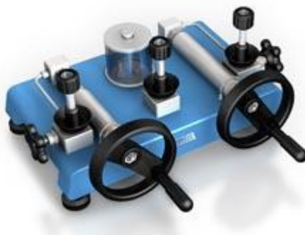
ADT 937 Pompe hydraulique 1000 bar

Pression: -jusqu'à 1000 bar. Media: huile Matériaux Adaptateurs: SST Corps de pompe: SST/aluminium Joint: Buna-N Connexion: 1/4" NPT femelle ou, 1/4" BSP femelle ou M20X1.5 femelle Connexion référence : 1/4" NPT femelle ou, 1/4" BSP femelle ou M20X1.5 femelle Dimensions Hauteur: 230 mm Base: 520 mm x 360 mm Masse: 16 kg