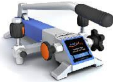
ADT 920 Pompe de test pneumatique -0.95 bar à 200 bar

Pression : -0.95 bar à 200 bar Résolution de réglage : 0,1mbar Media : air Matériaux Adaptateurs: SST Corps de pompe: SST/aluminium Joint: Buna-N Connexion : 1/4" NPT femelle ou, 1/4" BSP femelle ou M20X1.5 femelle Dimensions Hauteur: 178 mm); Base: 540 mm x 270 mm Masse : 6.5 kg