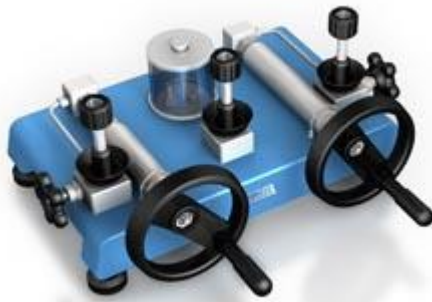
ADT 938 Pompe hydraulique 1000 bar