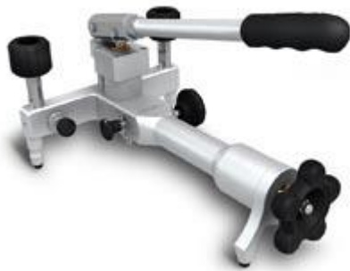
ADT 916 Pompe de test pneumatique -0.95 bar à 40 bar

Pression : -0.95 bar à 40 bar Résolution de réglage : 0,1mbar Media : air Ajustage fin et large Matériaux Adaptateurs: SST Corps de pompe: SST/aluminium Joint: Buna-N Connexion: 1/4" NPT femelle ou, 1/4" BSP femelle ou M20X1.5 femelle Dimensions: Hauteur: 140 mm Base: 315 mm x 198 mm Masse: 2.7 kg